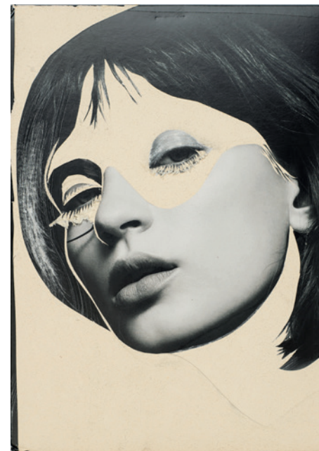
Häutung 6, 2018 Décollage – image publicitaire traitée au cutter et au papier de verre 29,5 × 21 cm