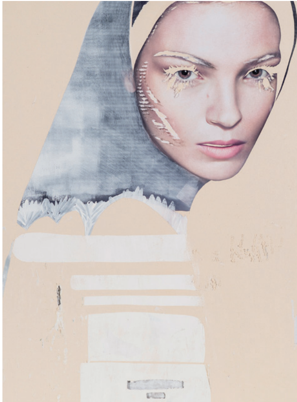
Häutung 1, 2017 Décollage – image publicitaire traitée au cutter, papier de verre et peinture 104 × 77 × 1,5 cm