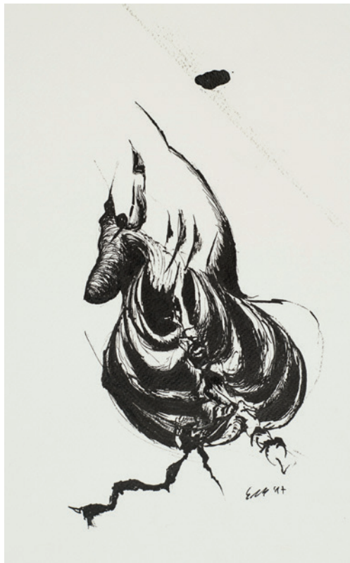
Corpus 2, 2017 Encre sur papier 32 × 24 cm