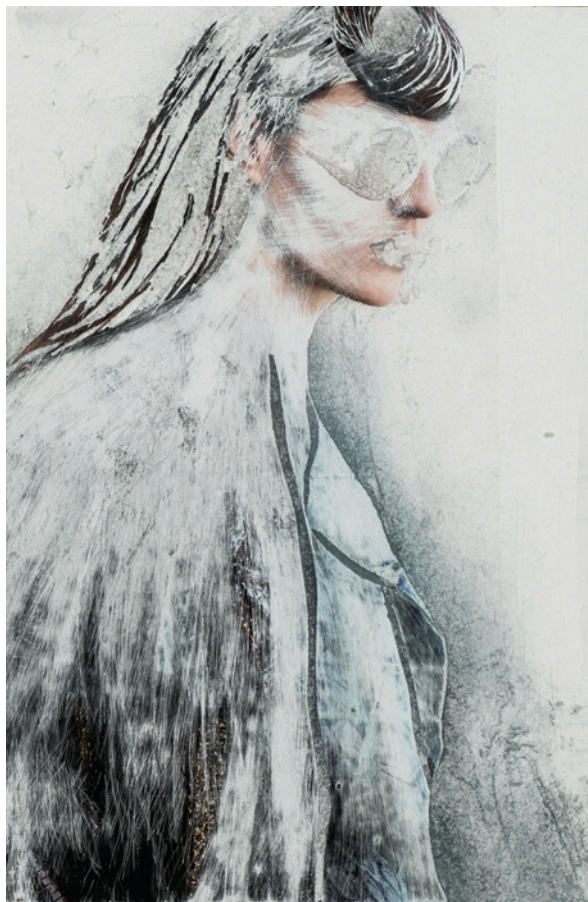
Häutung 7, 2018 Décollage – image publicitaire traitée au cutter et au papier de verre 18,8 × 18 cm