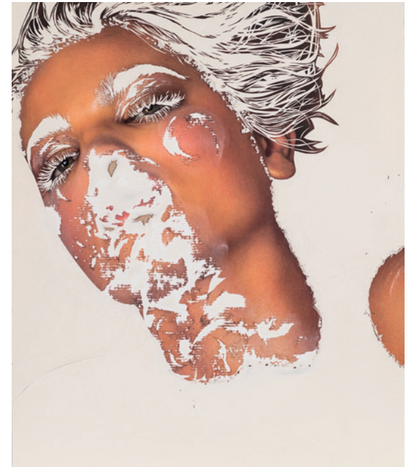
Häutung 3, 2017 Décollage – image publicitaire traitée au cutter, papier de verre et peinture 120 × 100 × 3,5 cm